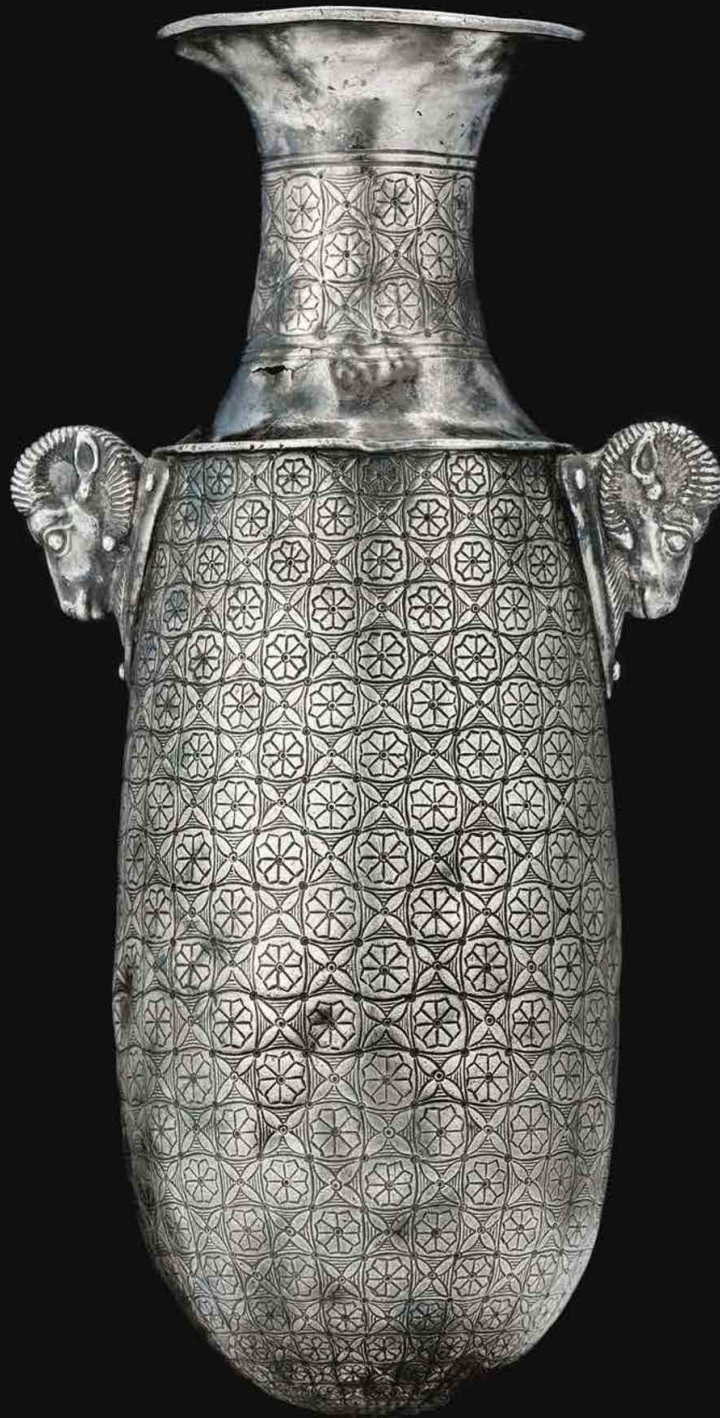
Alabastre , empire achéménide, V e siècle av. J.-C., argent, h. 26.1 cm. Galerie David Aaron.